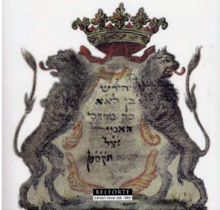
Fig. 3. - Copertina del libro da cui è tratta la traduzione utilizzata per il commento da Elena Lea Bartolini De Angeli.

Pereq Shirà, Il Capitolo del Canto, Autori Vari, Editore: Belforte Salomone, premessa, traduzione dall'ebraico e cura di Yarona Pinhas, introduzione di Malachi Beit-Arié, traduzione dall'inglese e redazione di Roberto Robotti. pp. 140 + tavole fuori testo, rappresentanti il manoscritto a colori, Livorno